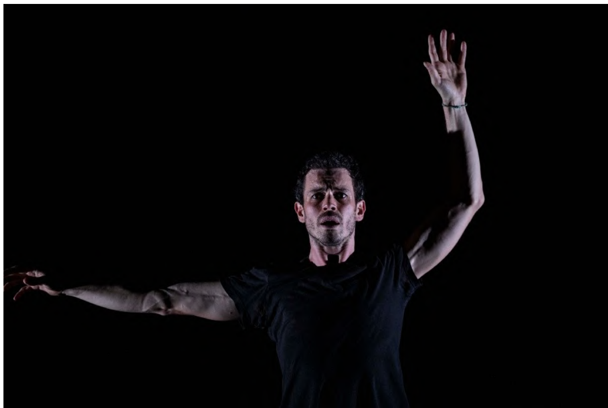
Photographies du spectacle © Jean-Louis Fernandez

Je me suis également inspiré pour écrire ce texte de références théâtrales et cinématographiques, telles que : C.R.A.Z.Y. de Jean-Marc Vallée, Oh Boy ! de Marie-Aude Murail et adapté pour le théâtre par Catherine Verlaquet, Cendrillon et Pinocchio de Joël Pommerat, Le Voyage de Chihiro d'Hayao Miyazaki, ou encore le personnage de Puck dans Le Songe d'une nuit d'été de William Shakespeare.